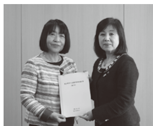
▲策定委員長(左)から教育長(右)へ計画を提出